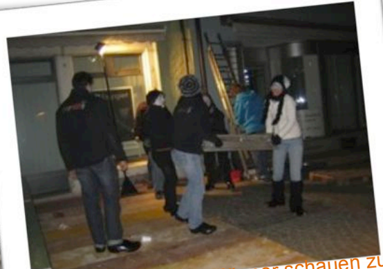
Die Frauen arbeiten, Männer schauen zu 😊