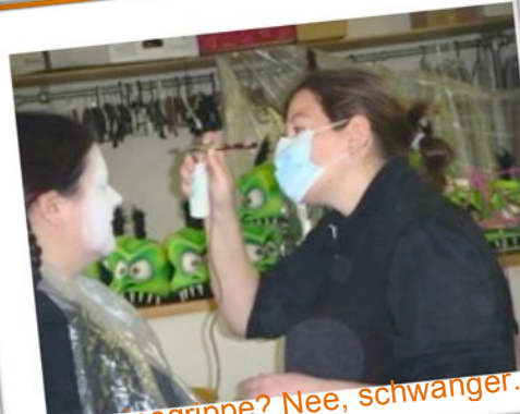
Schweinegrippe? Nee, schwanger. 😊