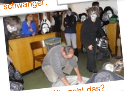
Unterrock? Wie geht das?